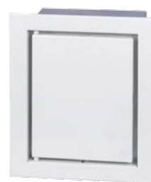
kaseta rewizyjna zaworu gazowego